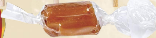
Bonbon caramel bio tende (soft organic caramel)