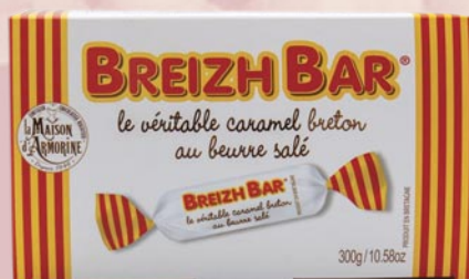
5 Boite beurre 300gr