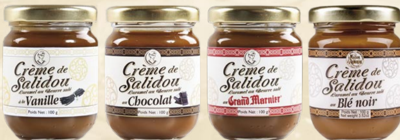
"Minis pots crème de Salidou®" - Vanille (Vanilla) - Chocolat (Chocolate) - Grand Marnier (Grand Marnier) - Blé noir (Buckwheat) Poids net 100 grs (100g glass jar)