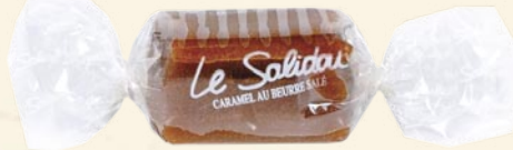
Bonbon Solidou tendre (soft caramel)