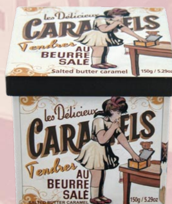
3 Boite fer caramel 150gr