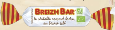
Caramel tendre "Breizh Bar" (soft organic caramel)