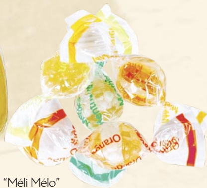
"Méli Mélo" de bonbons aux fruits (miel, citron, orange, menthe) (Assortiment of fruit candies - honey, lemon, orange, mint)