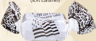
Bonbon BZH (soft caramel)