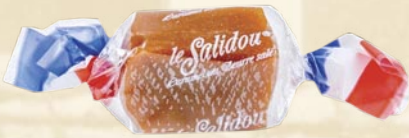
Bonbon tendre tricolore (soft caramel)