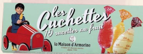
7 Étuis de 10 sucettes fruits ou caramels