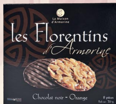
6 Étui florentins chocolat noir orange 70gr