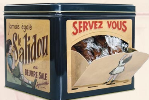
9 Boite "Servez-vous" 500gr de caramels tendres