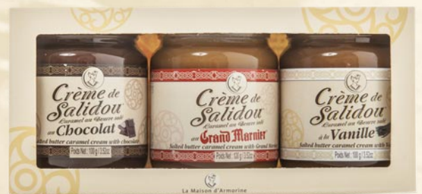
"Coffret crème de Salidou®" - Chocolat (Chocolate) - Grand Marnier (Grand Marnier) - Vanille (Vanilla) Poids net 3x100 grs (Gift pack 3 x 100g)