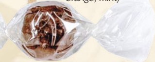
Bonbon caramel dur bio (hard organic caramel)