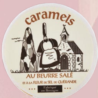
4 Mini boîte Mam Goudig 50gr