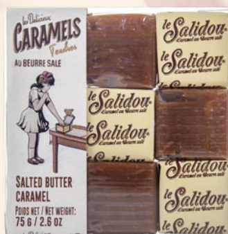
8 Étui pâtisseries 75gr