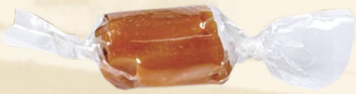
Bonbon caramel tendre (soft caramel)