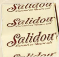
Caramel pâtissier solidou tendre (soft caramel)