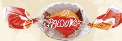
Bonbon la palourde "feuilleté Praliné" (hard caramel)