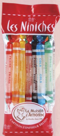
1 Sachet 15 Niniches fruits