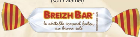
Caramel tendre "Breizh Bar" (soft caramel)