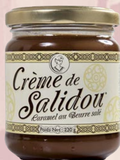
2 Crème de Salidou 220gr