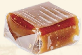
Caramel pâtissier tendre (soft caramel)