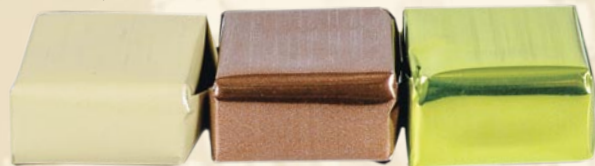
Pâtisseries mélangés (chocolat, vanille, fruits secs, fraise) (Assortiment of caramel sweets "pâtissier" - chocolate, vanilla, dried fruits, strawberry)