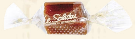
Bonbon mini Solidou (soft caramel)